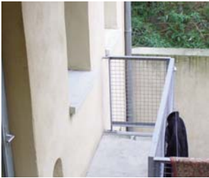
Résidence Masset / ASLIM

On constate une baisse de la mobilité en 2008, en comparaison avec 2007 (différence entre les entrées et les sorties).